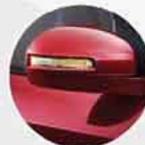
Outside Mirror + Turn Signal Lamp (tipe GX) Spion dilengkapi turn signal lamp baru yang lebih cool.