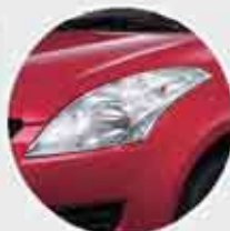
Headlamp Desain baru yang lebih dinamis untuk pencahayaan maksimal.