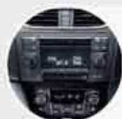
Advanced Audio Equipment Audio system yang kompatibel dengan digital audio player yang dilengkapi Audio Switch Control (khusus tipe GX) di steering wheel.