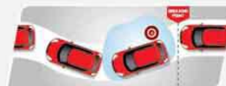
ABS (Anti-lock Brake System) + EBD (Electronic Brake Distribution) (tipe GX) Mencegah ban terkunci saat pengereman mendadak untuk meningkatkan keamanan berkendara.