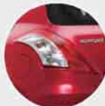
Rear Combination Lamp Desain baru yang menyatu dengan kontur bodi & tampil lebih stylish.