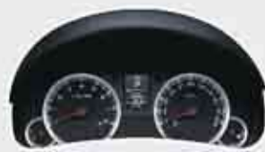
High-grade Meter Cluster + Multi Information Display Desain sporty didukung MID digital dengan fitur indikator jam, jarak tempuh, konsumsi bahan bakar hingga suhu di luar kabin.