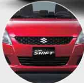
Front Grille Tampilan U-shape baru yang lebih trendi & sporty.

Dengan desain baru yang lebih stylish All New SWIFT tampil makin sporty