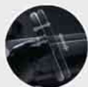
Tilt-Telescopic-Adjustable Steering Wheel Kemudahan pengaturan steering wheel sesuai kenyamanan pengemudi.