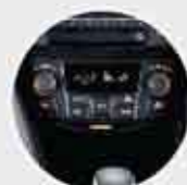
Automatic Air Conditioner (tipe GX) Pengoperasian AC dengan fitur Auto Control Switch yang mampu menyesuaikan suhu kabin secara otomatis sesuai suhu yang diharapkan.