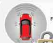
Alarm + Immobilizer Fitur berteknologi canggih untuk mengurangi resiko pencurian.