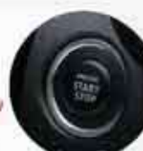
Keyless Push/Start System

TECT (Total Effective Control Technology) Penggunaan baja super kuat untuk jaminan keamanan & bobot bodi lebih ringan.