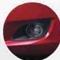
Foglamp (tipe GX) Desain baru dengan pencahayaan yang lebih optimal.