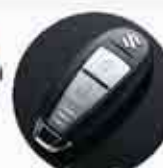
Keyless Entry System