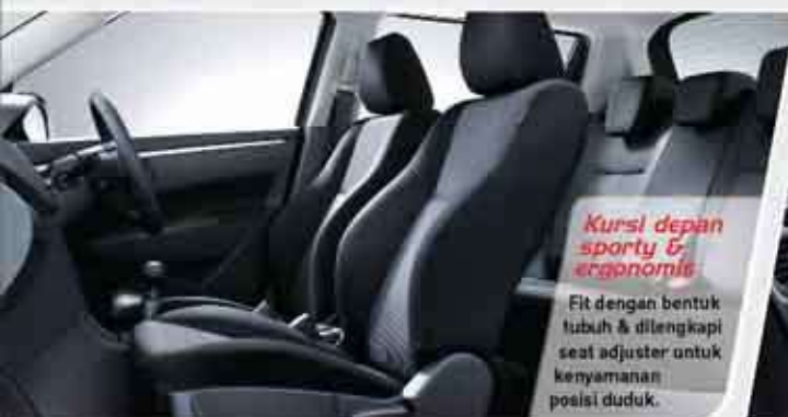
Kursi depan sporty & ergonomis Fit dengan bentuk tubuh & dilengkapi seat adjuster untuk kenyamanan posisi duduk.

Dengan desain baru yang lebih mewah dan nuansa hitam yang sporty