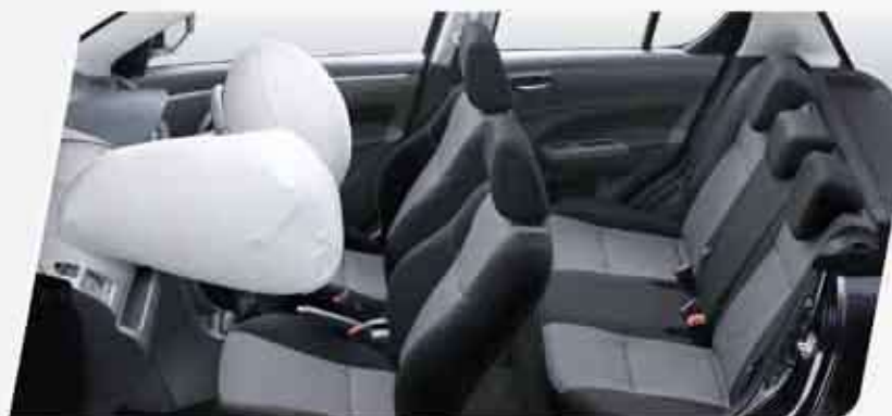
Dual SRS Airbag (tipe GX) Airbag akan melindungi & mengurangi resiko cedera pada pengemudi & penumpang depan saat terjadi benturan frontal.

Dengan fitur berteknologi mutakhir yang memberi kemudahan & perlindungan lebih baik