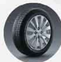
16" Aluminium Wheel Desain alloy wheel baru yang lebih besar & sporty.